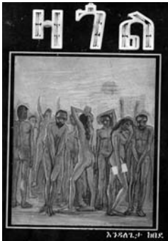
በ1998 ዓ.ም. የታተመው የእንዳለጌታ ከበደ አዲሱ ረድም ልብወለድ።

ከደራሲው ብዙ የሚጠበቅ አይመስለኝም - ማለት እንዲነበብለት። የውይይትና የንባብ ክበባት ይህንን ነገር ማጉላትና ማራመድ ይችላሉ። በመገናኛ ብዙኃን የጥበባት ፕሮግራምም አዳዲስ መጻሕፍት ሲወጡ በማስተዋወቅ የአንባቢያን ቁጥር እንዲበዛ ማድረግ ይቻላል። የቴሌቪዥን ሚዲያ ስናይ የስዕል ኤግዚቢሽን ሲከፈት ርጠው ያቀርባሉ፤ ጥሩ ነው ደስ ይላል። ደራስያን መጽሐፍ በሚያስመርቁበት ሰዓት ግን ብዙ አይመጡም። አንባቢንና ድርሰትን ለማገናኘት የሚያደርጉት ጥረት የደከመ እንደሆነ ነው የሚሰማኝ። እነዚህ ሁሉ ድክመቶች መቀረፍ ቢችሉ በተወሰነ መንገድ የአንባቢያንን ቁጥር ማብዛት እንደሚቻል አስባለሁ።